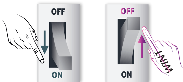
Aktywacja negatywnego mechanizmu komórkowego

Wyłączenie negatywnego mechanizmu komórkowego